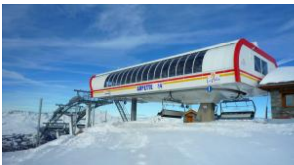
Jeden z pohledů na vrcholovou stanici TSD6 Les Arcs