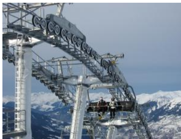
Seskupení traťových podpěr s kladkovými bateriemi před vrcholovou stanicí TSD-6 Les Arcs

Společně s celou technologií lanovky, která sahá od podpěr až po pohon, se představuje BMF BARTHOLET víc než jako „kompletní dodavatel“ pro celé odvětví lanových technologií. Přitom panu Spiegelbergovi jde především o to, aby mohl nabídnout co „nejjednodušší“ technologii, tzn. s minimálními náklady na údržbu: „Většina odpojitelných lanovek je celkem nových. Ale mnozí uživatelé nás přesvědčují, že s dosavadní technikou během let nadměrně narůstají náklady na údržbu. Zde zřetelně vidíme, že trh vyžaduje jednoduchá řešení, která může nabídnout BMF BARTHOLET.“